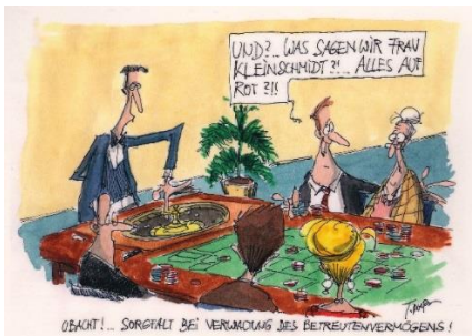
Grafik von Th. Plassmann

Referent: Malte Poppe, Schuldnerberater im Diakonischen Werk Rheinhessen